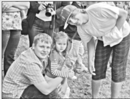
Kad lielie brāļi tiek pie mazām māsiņām un brāļiem...