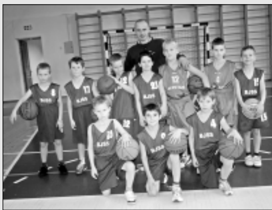
Jauni basketbolisti Madonā cinās divas dienas.